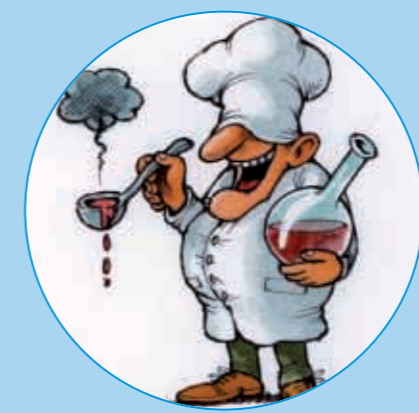
(Vignetta del "cuoco-chimico" di Roberto Mangosi, per gentile concessione dell'autore)

Perché alcuni alimenti devono essere cotti? Perché cuciniamo certi cibi assieme ad altri? Per rispondere a queste e altre domande dobbiamo conoscere le trasformazioni del cibo. La chimica studia la materia e le sue trasformazioni, la cucina è l'arte di trasformare gli alimenti. Variazioni di colori e profumi sono le formule magiche che usiamo ogni giorno in cucina e la chimica ci aiuta a svelarne il segreto. In questa giornata toccherete con mano la chimica in cucina.